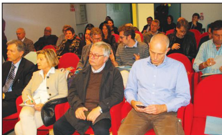
Venerdì 16 novembre. Cuneo, via Carlo Boggio. Sede Asl Cn1. Due momenti della conferenza stampa organizzata per presentare i progetti legati alla riduzione delle liste d’attesa.