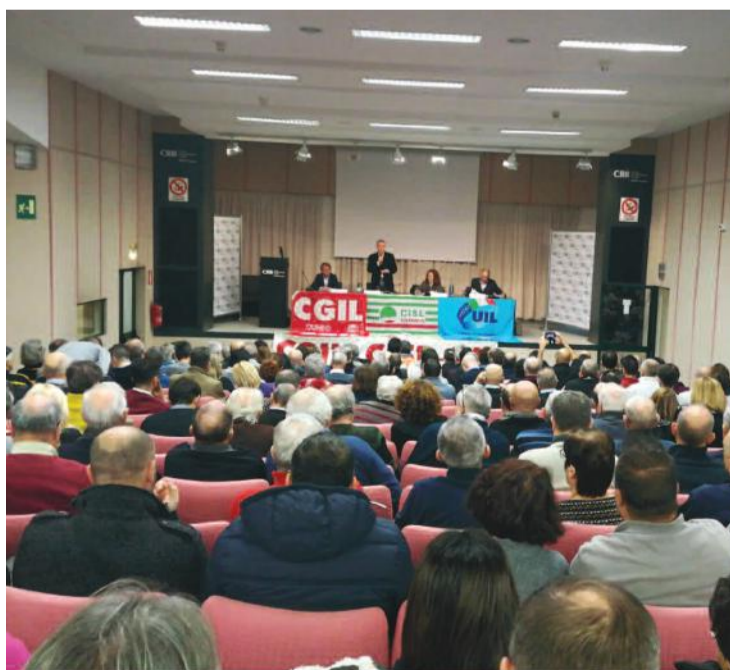
Bra. Lunedì 26 novembre. Auditorium CRB. Salone gremito per l'attivo unitario Cgil Cisl e Uil Cuneo. Contenuto della mattinata, la legge Finanziaria 2019 definita dall'attuale Governo Lega-5stelle ed ora al vaglio del Parlamento. Tanta partecipazione e tanti interventi pertinenti. Ed il Governo che dice? Aprirà un confronto con i sindacati?

Tutto questo chiediamo unitariamente come sindacati al Governo del Paese. Vogliamo essere ascoltati, vorremmo che venisse aperto un tavolo di confronto che nel merito valuti i contenuti di una Legge di Bilancio davvero molto delicata per i destini del nostro Paese.